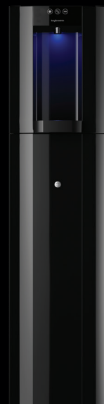
Schwarz - Standgerät