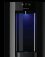
Schwarz - Obertisch