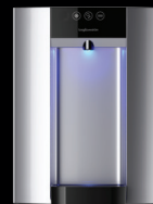
Silber - Obertisch