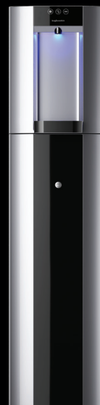
Silber - Standgerät