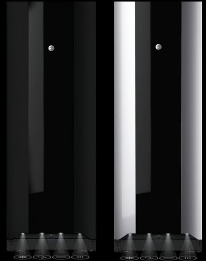
Schwarz – Standgerät